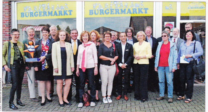
Zum Abschluss des Besuchs gab es ein Gruppenfoto vor dem Bürgermarkt.

in den Räumlichkeiten des Bürgermarkts kostenlos folgende Beratungen an: ALG II-Beratung, Schwerbehindertenberatung, Schuldnerberatung, Beratung des Senioren- und Pflegestützpunktes und Beratung zum „Teilhabepaket“. Es gibt außer-